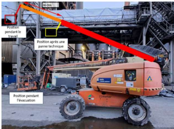
Gand mars 2024

Accident à Gand du 16/03/2024 : Une nouvelle fois la longe sauve la vie de l'agent qui était dans le panier de la nacelle