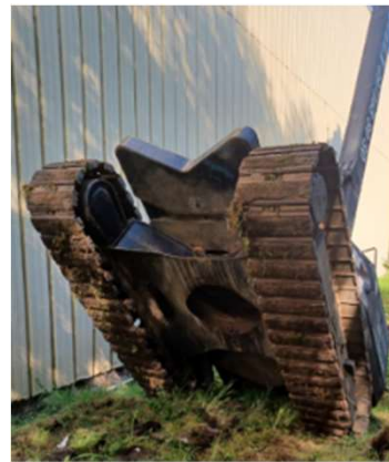
Mardyck septembre 2023

Malgré une rétractation brutale et soudaine de 3m du mât de la nacelle qui soulève l'opérateur, celui-ci n'est pas éjecté du panier de la nacelle. Sa longe courte et attachée au point d'ancrage lui a évité une chute peut-être fatale.