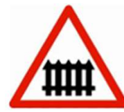
Passage à niveau avec barrières