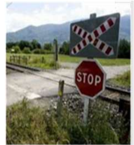
Croix de Saint-André Implantée à proximité immédiate des passages à niveau non protégés