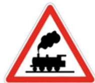
Passage à niveau sans barrière