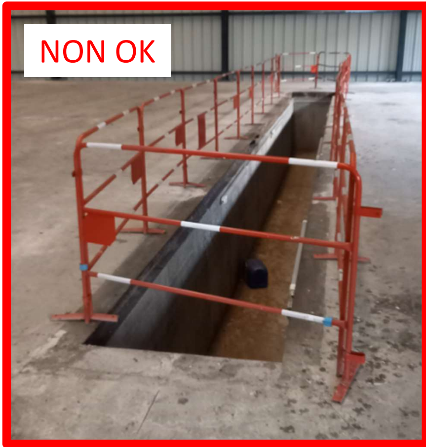
Barrières au bord du trou Barrières non fixées, démontables sans outil N'évitent ni la chute, ni l'accès