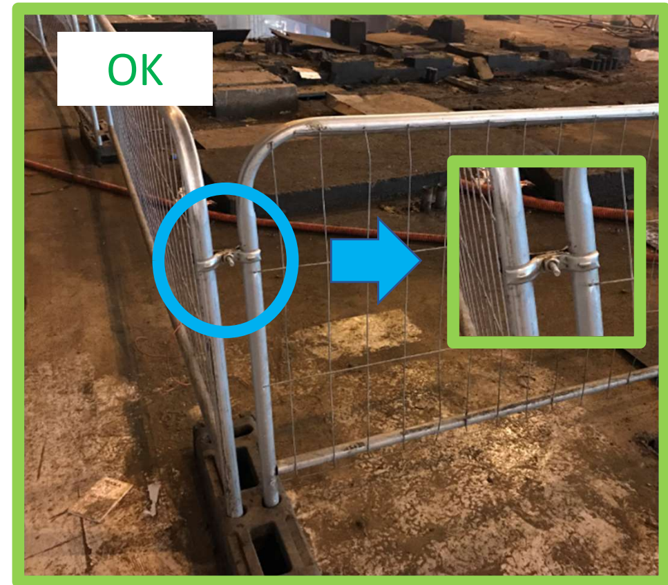
Barrières à + 2m bord du trou Barrières non démontables sans outil Un colson peut aussi être utilisé